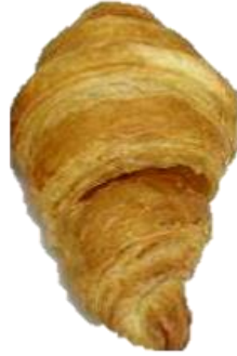
เป็น โพรง