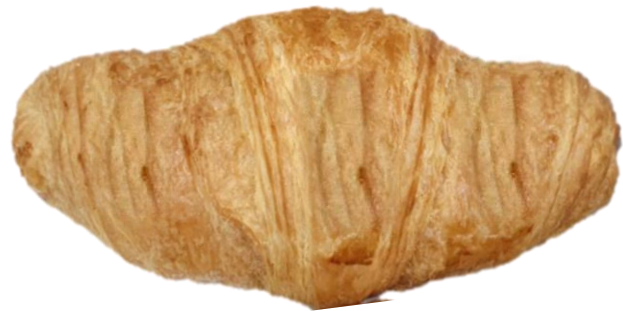
ครีวซอกค์ไม่ครบชั้นตามที่กำหนด (5-7 ชั้น)