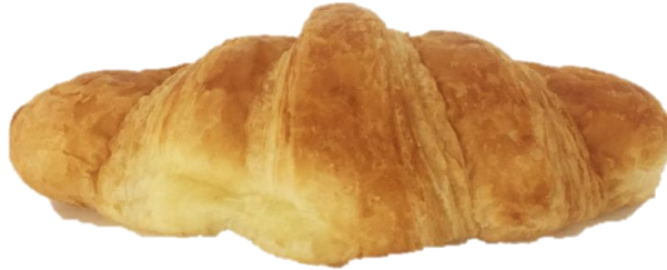
ครีวซอกค์เป็นไต